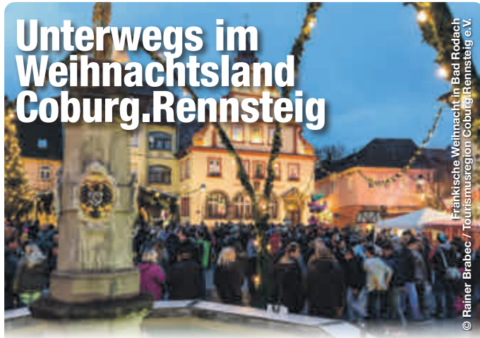
Fränkische Weihnacht in Bad Rodach

TreffpunktDeutschland.de/ weihnachtsmaerkte